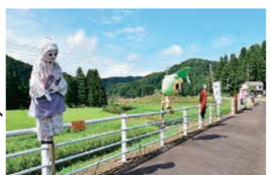
▲毎年お盆時期に開催する「かかしまつり」

感染症の影響で、多くの地域行事が中止になりました。住民の高齢化も進み、これまでのような行事の継続も難しくなっています。 田之口集落の「かかしまつり」は10年以上続く地域の恒例行事。今年は感染症による自粛やかかしの作り手不足で開催が危ぶまれましたが、同様の祭りをを行う小国地域からかかしを借りることで実現できました。 住民だけでは難しい地域間の連携や調整をしているのですが、地域の支えになっていければうれしいです。「何が問題なのか」「どんなことをしたいのか」などの声に耳を傾け、住民主体で地域の交流が続くよう、これからも地域を見守っていきたくです。