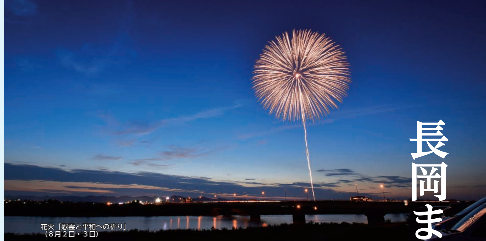
花火「慰霊と平和への祈り」 (8月2日・3日)

※この他にも感染症対策のためにお願いすることがあります。詳しくは公式ホームページをご覧ください