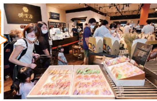
9月にオープンしたばかりのながおか花火館。体操の後は、館内を巡ってみませんか。

つきいちひろばinながおか花火館 11月26日(木)、12月10日(木)午前10時30分～11時30分