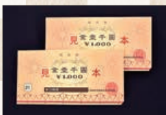
④長岡市共通商品券（2,000円）…8人