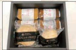
③みそ4種・チーズのみそ漬けセット…7人