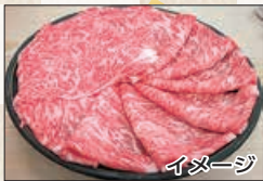
①山古志産にいがた和牛…6人