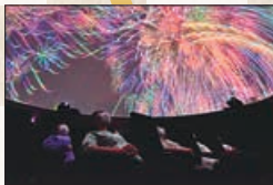
②ながおか花火館シアターペア鑑賞券…10人