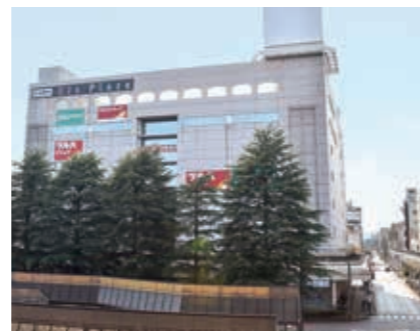
▶ディアプラザ長岡