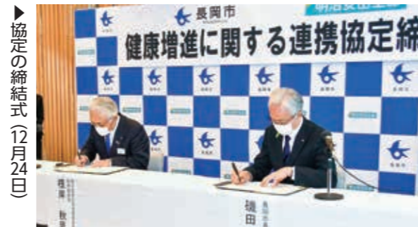
協定の締結式（12月24日）