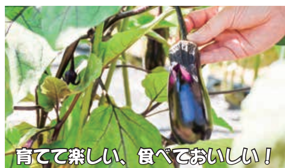
育て楽しい、食べておいしい!

●「菜園きぼう」(希望が丘2・3丁目付近)利用者 日令和4年4月から3年間 日市内在住者 日6区画(先着1区画20㎡) 日1区画年2,000円 日市民協働課生涯学習係(さい)☎39・2388