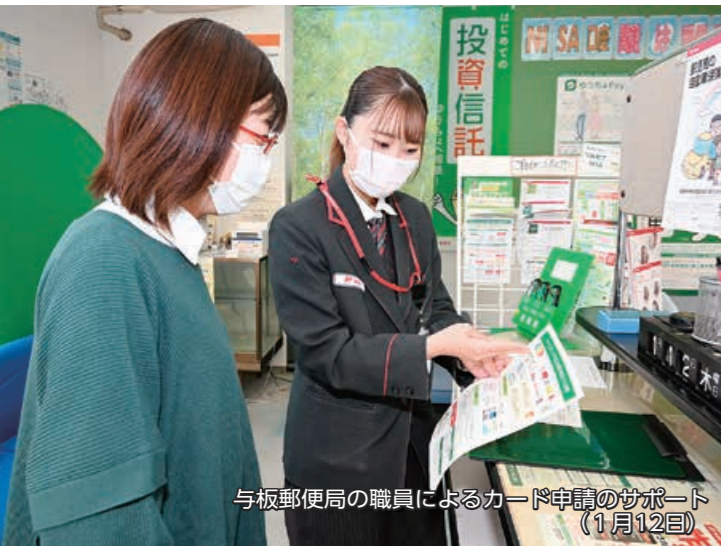
与板郵便局の職員によるカード申請のサポート (1月12日)