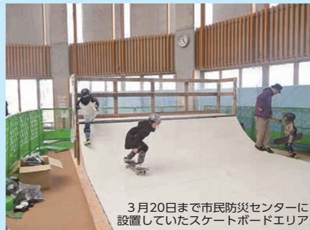
3月20日まで市民防災センターに設置していたスケートボードエリア