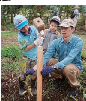
▲子どもも参加できる植樹会

時 5月5日(祝)午前10時～午後3時(雨天決行) 内 植樹、冒険遊び、石窯ピザ焼き・バウムクーヘン作りなど 持 長靴、軍手、昼食、箸、おわんなど 料 小学生以上100円 場 赤城コマランド・山川さん ☎090・3215・8256 担当=政策企画課(ア) ☎39・2204