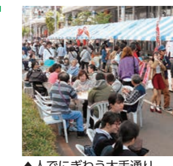
▲人だにぎわう大手通り

◆図や表などの略字の見方は12ページ ◆図どなたでも、図特になし、図無料、図不要(直接会場へ)の場合は、記載なし ◆図に電話、ファクス、Eメール、図(市ホームページ)の記載がある場合は、その方法で申し込み可 (ア) = アオーレ長岡 (市) = 市民センター (大) = 大手通り舎 (さい) = さいわいプラザ