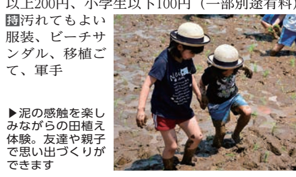
▶泥の感触を楽しみながらの田植え体験。友達や親子で思い出づくりができます

時 5月20日(日)午前10時30分～午後2時(雨天決行) 場 農の駅あぐらって長岡 内 田植え、いも苗植え、田んぼの生き物探し、陶芸体験など ※豚汁付き、秋には新米プレゼント 料 中学生以上200円、小学生以下100円(一部別途有料)