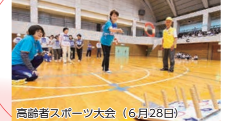
高齢者スポーツ大会（6月28日）