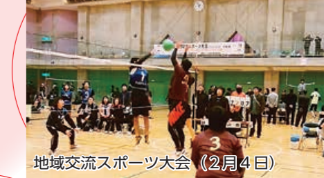
地域交流スポーツ大会（2月4日）