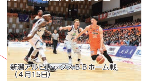
新潟アルビレックスBBホーム戦（4月15日）