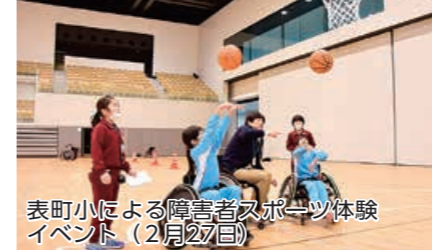
表町小による障害者スポーツ体験イベント（2月27日）