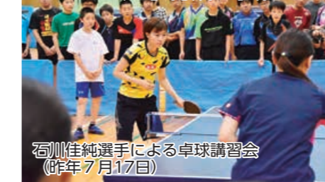
石川佳純選手による卓球講習会（昨年7月17日）