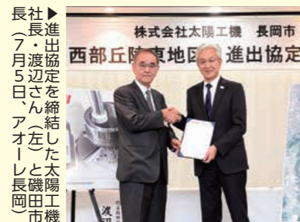
長社 ▶ 長岡市 株式会社太陽工機 長岡市 西部丘陵東地区 進出協定

西部丘陵東地区（高頭町ほか）に、工作機械メーカーの（株）太陽工機の進出が決まりました。 同社は雲出工業団地（西陵町）に本社を置き、自動車部品や工作機械部品などをマイクローメントル単位で加工できる研削盤を開発、製造。海外