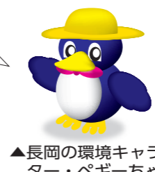
▲長岡の環境キャラクター・ペギーちゃん

ごみは、収集日を確認して、必ず午前8時30分までに 出しましょう。 ごみの分別に一層のご理解とご協力をお願いします。