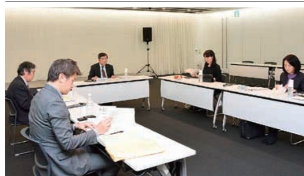
▲入札・契約制度に関する検討委員会の第2回会合。委員は大学教授や弁護士など5人が務めます(3月19日)

職員倫理…コンプライアンス課 ☎39・2368 入札・契約制度…行政管理課 ☎39・2208