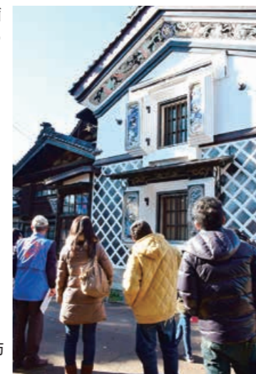
▶県内外から観光客が訪れる鏡絵蔵