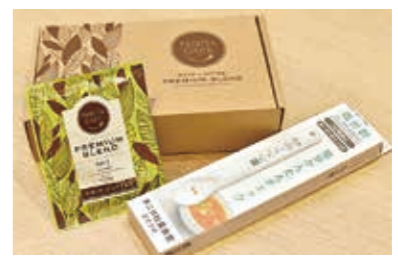
▲企業協賛品のイメージ。健康づくりイベントなどでの配布で、企業PRにつながります

日)、古文書や災害に関する新聞資料などの整理、市外ボランティア団体との交流研修会を行っています。現在52人が登録。初めての人も大歓迎です。 活動説明・見学会Ⅱ5月9日(木)午前9時30分～正午 ☎互尊文庫 ☎図書資料室 ☎36・7832 ●ふれ愛コンサートinながお 9月29日(日)にアオーレ長岡で開催する、障害のある人もない人も楽しめる手作りコンサートです。 ●実行委員 ☎コンサートの企画・運営 ☎18歳以上で毎月1回程度の会議と当日の運営に参加できる人 ●出演者 ☎15分程度の出演 ☎県内での活動している音楽・ダンスなどの団体・個人 ●いづれも ☎5月17日(金)24日(金)までに福祉課 ☎アオ ☎39・2343、☎アオ ☎39・2256、Eメール fukushika@city.nagaoka.lg.jp