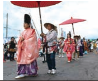
▶82人による平安行列。本格的な衣装で練り歩きます

☎8月18日(日) ☎柏崎農協小国支店カントリーエレベーター前特設会場 配役・☎以仁王・小国頼重・公家…各男性1人、桜木姫・紅梅御前…各女性1人、武士…男性8人、侍女…女性4人 ※応募多数の場合は選考あり ☎6月14日(金)までに住所、氏名、年齢、連絡先、希望配役、身長、足のサイズをもちひとまつり実行委員会事務局(小国支所産業建設課内) ☎95・5906へ