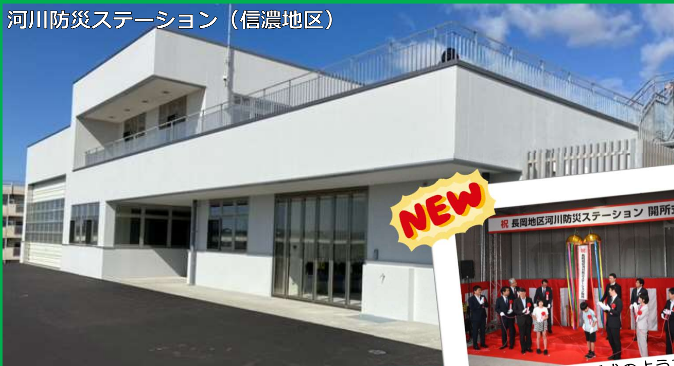
河川防災ステーション（信濃地区）