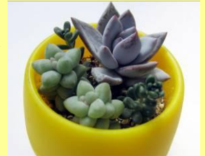
▲インテリアとして手軽に楽しめます

時 間：午後1時30分 ～2時15分 材料費：200円 定 員：20人（先着） 申込み：当日先着