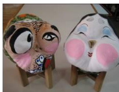
▲絵描き後のおかめかぼちゃ