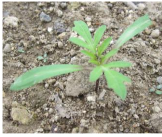
▲タネまきから10日目