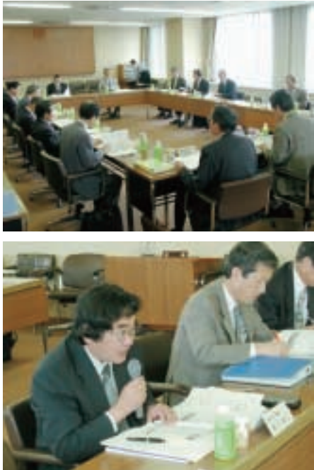
新市建設計画策定小委員会のような

新市将来構想では住民の思いや期待、長岡地域の特色ある地域資源(地域の強み)から新市の住民(市民)が共有していく「地域らしさ価値」とその価値を高めるための「重点実現項目」が策定されました。