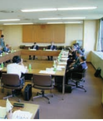
回小委員会のような