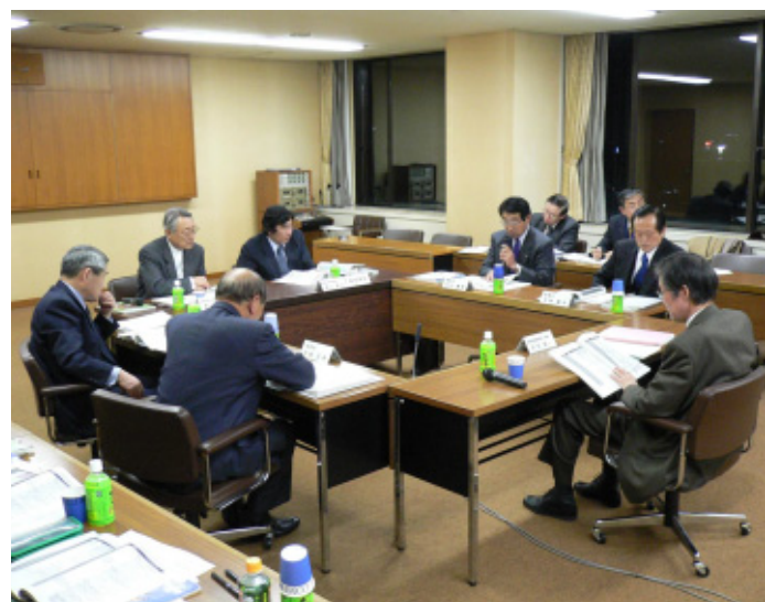
第2回新市建設計画策定小委員会（長岡市役所）

現在ほとんどの業務がコンピュータ化されていることから、電算データの移行、システムの統合にある程度の期間が必要なこと、統合したシステムの運用が間違いないか行えるかの確認を確実に終わらせる必要があることなどから、合併日の前後に休日のある1月1日とされました。