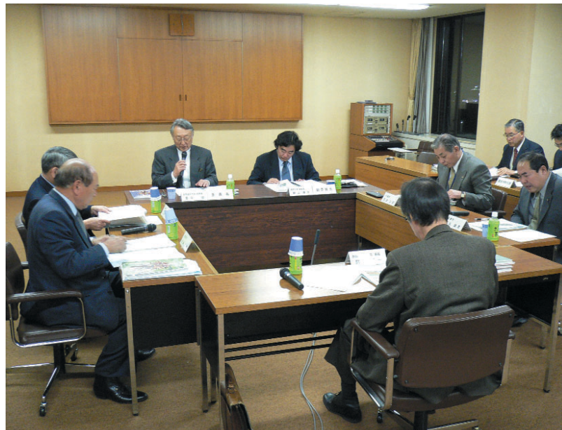
第3回新市建設計画策定小委員会(長岡市役所)

現在ほとんどの業務がコンピュータ化されていることから、電算データの移行、システムの統合にある程度の期間が必要なこと、統合したシステムの運用が間違いなく行えるかの確認を確実に終わらせる必要があることなどから、合併日の前後に休日のある1月1日とされました。