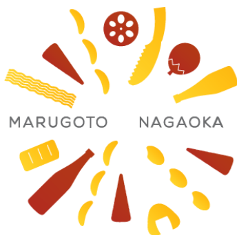
長岡市公式ショップ 丸ごとながおか