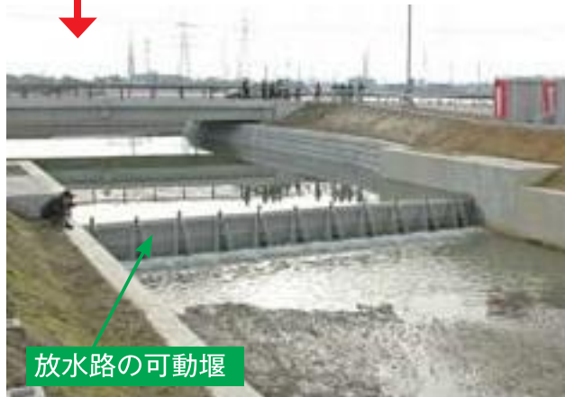
稲葉川(奥)から猿橋川へ水を流す放水路(手前)