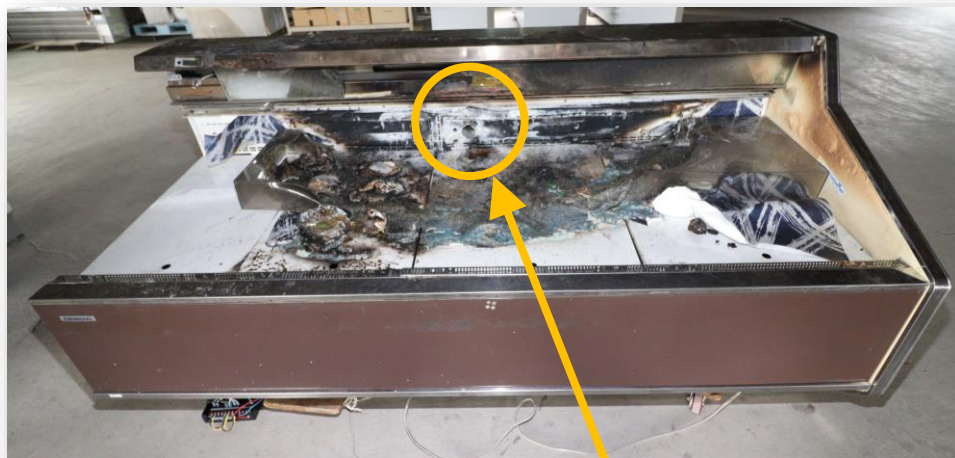
火災が発生した冷蔵ショーケース

※トラッキングとは・・・コンセント又はプ ラグにほこりや水分が付着し、電気が 流れ、炎が発生すること。