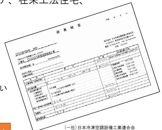
(一社)日本冷凍空調設備工業連合会