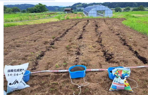
▲畝立前に各肥料を施肥