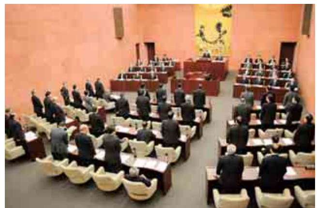
平成23年度一般会計当初予算を賛成33人、反対5人の賛成多数で可決しました（3月28日）

一般会計の予算額は1,519億3,900万円。長引く景気低迷に対処するため、経済・雇用・生活対策を最優先課題としつつ、長岡の魅力を全国に発信する「シティプロモーション」の推進などに力を入れた予算となりました。（予算に対する各会派の評価は4ページ）