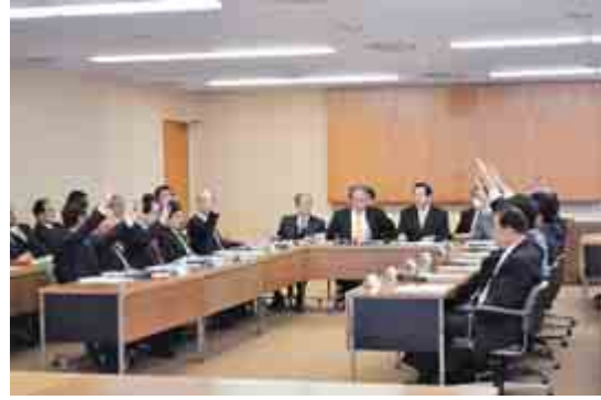
議会運営委員会において、賛成多数で国旗・市旗の掲揚を決定（2月15日）