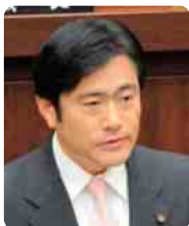
中村 耕一 議員 (1期・公明党)

答 市はこれまで、商工会議所や職業安定所などと連携し、障害者雇用の促進を図ってきた。また、平成20年度に、障害者を多数雇用している事業者から、物品等を優先的に調達する制度を創設したほか、22年度には、障害者の就労支援に向け、特色ある取り組みをしている企業の事例集を作成した。さらに23年度は、市役所において障害者の職場実習を受け入れ、一般企業就労に向けたスキルアップの場を提供する。こうした取り組みを通じて、障害者雇用の拡大を図っていきたい。