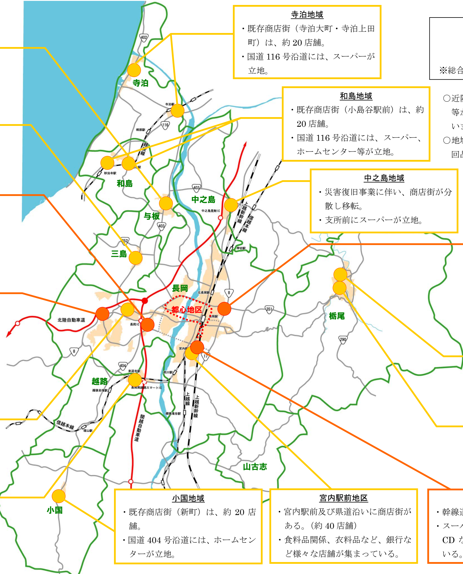
図 主な商業集積の分布状況

宮内駅前地区 ・宮内駅前及び県道沿いに商店街がある。（約 40 店舗） ・食料品関係、衣料品など、銀行など様々な店舗が集まっている。